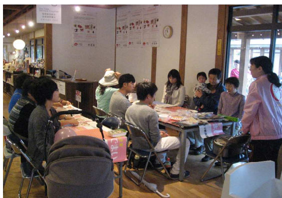
<イベントスペースでのワークショップ開催>