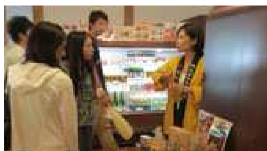
<ミニイベントの様子>