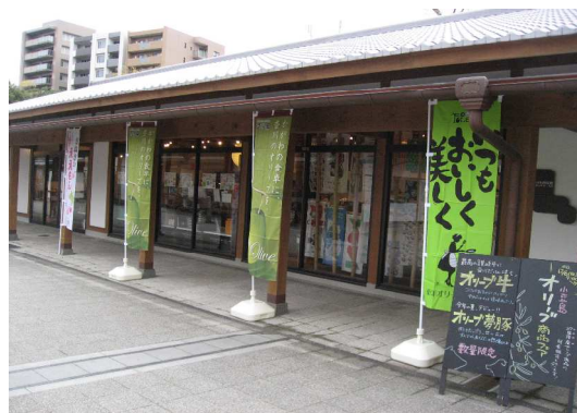
<フェア開催の様子>