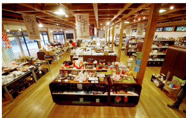
<特産品ショップの様子>