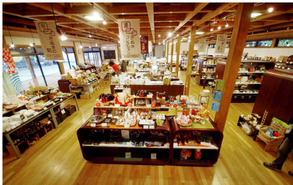
<特産品ショップの様子>