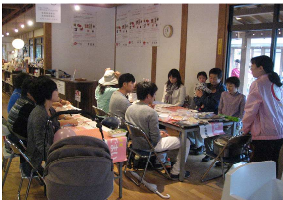
<イベントスペースでのワークショップ開催>