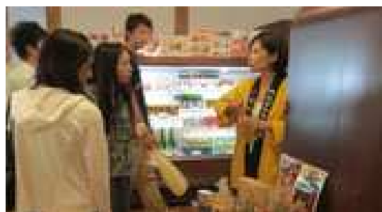
<ミニイベントの様子>