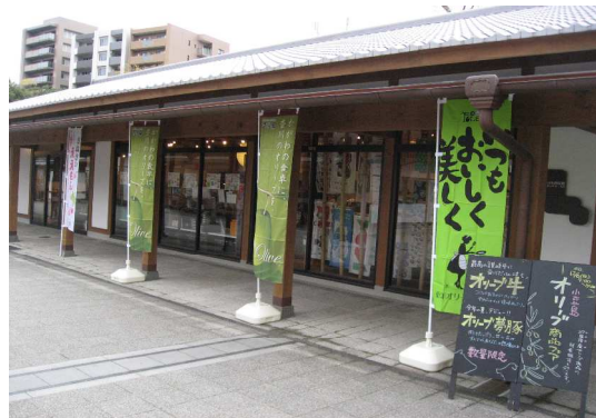
<フェア開催の様子>