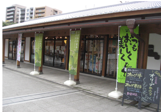
<フェア開催の様子>