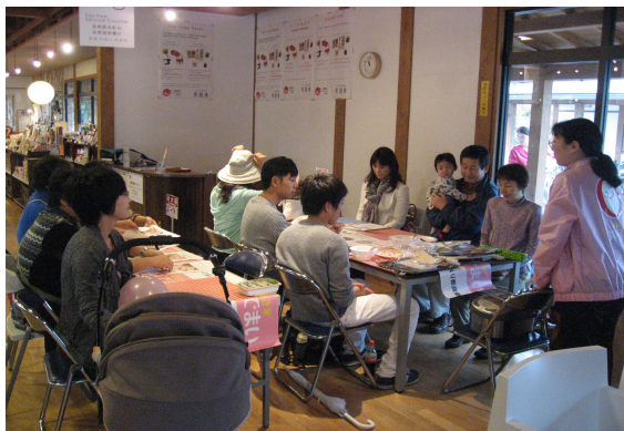
<イベントスペースでのワークショップ開催>