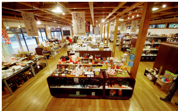
<特産品ショップの様子>