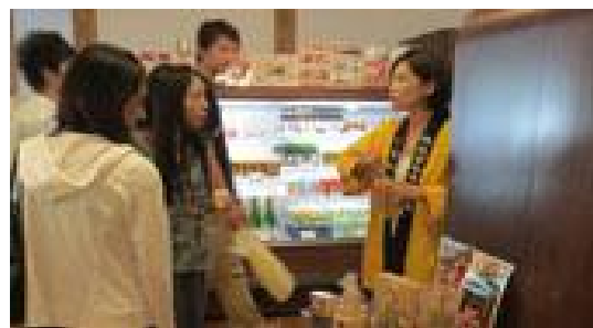
<ミニイベントの様子>